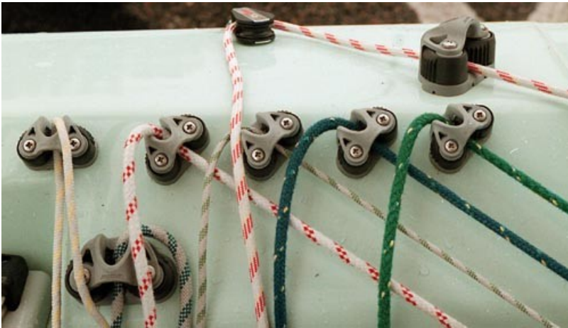
En annan bild på kontrollen sett från sittbrunnen