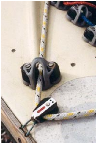
Kontrollen Centerbordets kontroll framdragen till sittbrunnskanten.